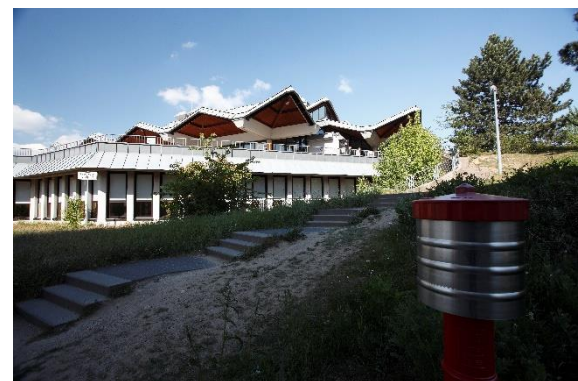
Eindrücke vom Campus: Die Zentralmensa.

Die Webseite der Fachschaft finden Sie hier: Fachschaftsrat