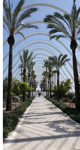
Ab in den Süden! Zum Beispiel an unsere Partneruniversität in Valencia, Spanien

06131 – 39 21021; Sprechstunde in der Vorlesungszeit: dienstags, 10:00 – 11:30 Uhr