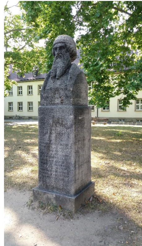
Eindrücke vom Campus: das Gutenberg-Denkmal

Neben dem BAföG können Sie auch durch Studienkredite Ihr Studium finanzieren. Hier fallen i.d.R. Zinsen für die Darlehen an. Daher sollten Sie sich umfassend informieren. Anbieter von Studienkrediten ist neben den Banken und Sparkassen auch die KfW.