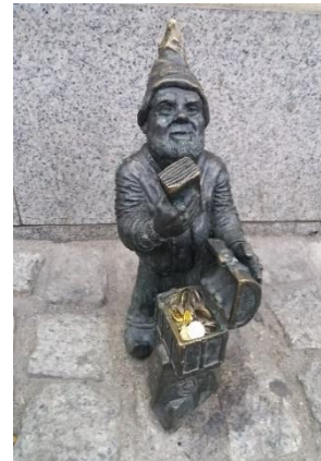
Was hat dieser Zwerg mit politischem Protest zu tun? Die Antwort finden Sie in Wroclaw, Polen