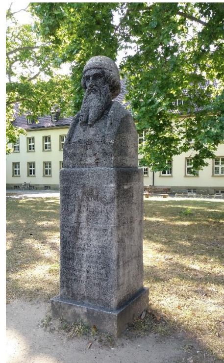
Eindrücke vom Campus: das Gutenberg-Denkmal

Neben dem BAföG können Sie auch durch Studienkredite Ihr Studium finanzieren. Hier fallen i.d.R. Zinsen für die Darlehen an. Daher sollten Sie sich umfassend informieren. Anbieter von Studienkrediten ist neben den Banken und Sparkassen auch die KfW.